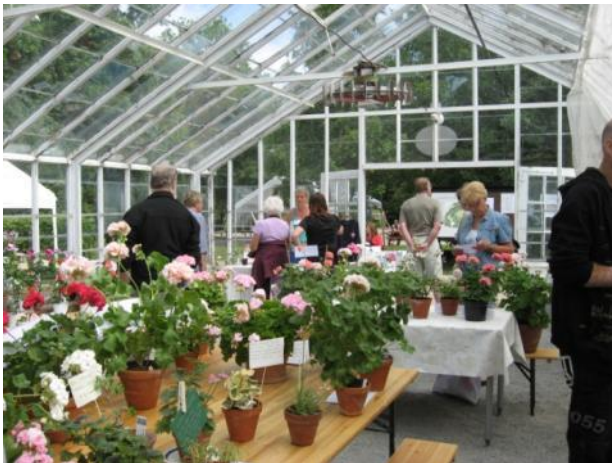
Vid pelargonutställningen 12 juni visades de vackraste och mest intressanta pelargonerna upp för besökarna.

Våren och sommaren tillhör ”vårt” område, sådd och omvårdnad för att senare njuta av blomprakten, skörden, dofterna - vad det nu kan vara. Smaken är delad som man säger, en vill ha bara dofterna, en annan vill ha prakten och stilrenheten som en trädgård kan ge.