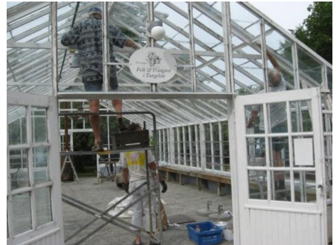
Några flitiga medlemmar ägnade en del av juli åt upprustning av växthuset.

Jag vill puffa för att vi i styrelsen nästa år (2012) kommer att utse Årets Tungelsträdgård. Här är det originalitet, artrikedom, planlösning, tillgänglighet osv. osv. som kommer avgöra vem vi väljer. Ett bra tillfälle att visa upp er trädgård, eller om ni vill nominera någon annans trädgård så går det också bra.