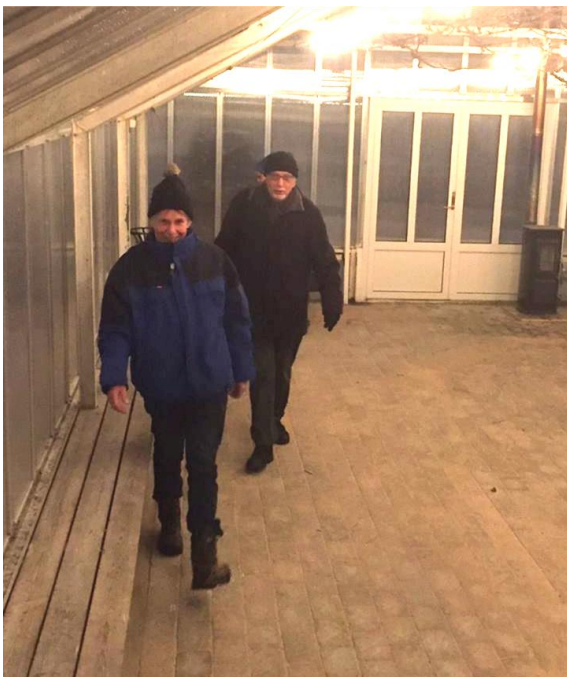
Ordföranden går inspektionsrond på det nya golvet.

Under januari har vi lagt marksten i växthuset, tumlad sten som ger en fin yta att gå på och det underlättar för våra rörelsehindrade att utnyttja växthuset. Fint blev det och kommer säkert bli en fördel vid våra uthyrningar fram igenom.