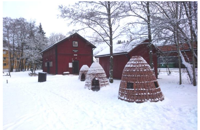
Kojorna är spännande att krypa in i.

Vi ser fram emot ombyggnaden av lekplatsen, redan nu kan man se några flätade "tipi" för de yngsta att leka i. Lekplatsen skall vara klar under 2019, om inget sätter hinder i vägen för det. Grillplatsen vet jag blir klar under året. För den som eventuellt har missat det kom den nya parkbelysningen upp under 2018.